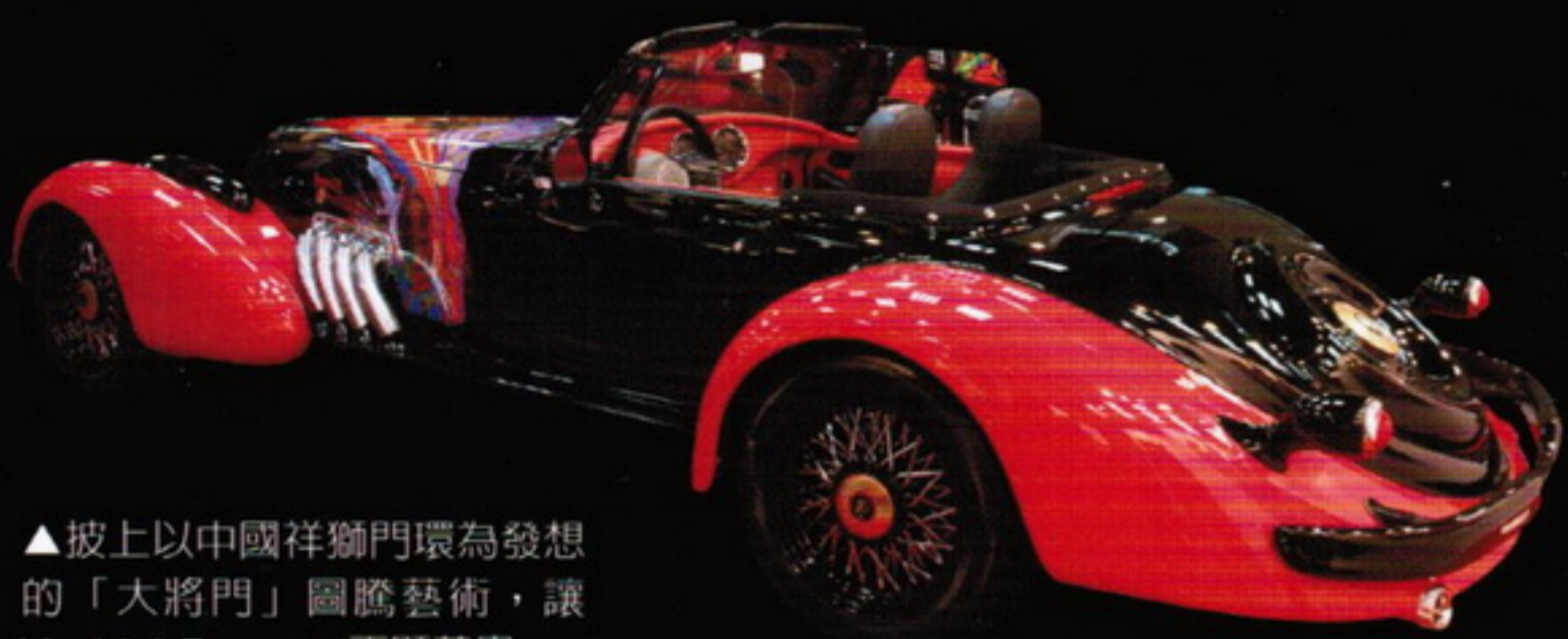
▲披上以中國祥獅門環為發想的「大將門」圖騰藝術，讓Vicci 6.2 Emperor I更顯華貴。

Vicci字面意謂征服，這款新古典跑車為DiMora 2014年推出的最新車款，融合1930年代的優雅風格與21世紀的當代藝術，車身及前後保桿等許多零件皆以碳纖維打造，並擁有24K金防火牆、輪圈蓋和油箱蓋。動力部分，頂級HS車型搭載GM集團提供的LS-A 6.2升V8機械增壓引擎，搭配Hydra-Matic四速自排變速箱（另可選配六速手排），0~100km/h加速僅需4秒，極速達300km/h！值得一提的是，HS車型還配備了後軸限滑差速器，操控樂趣令人期待。