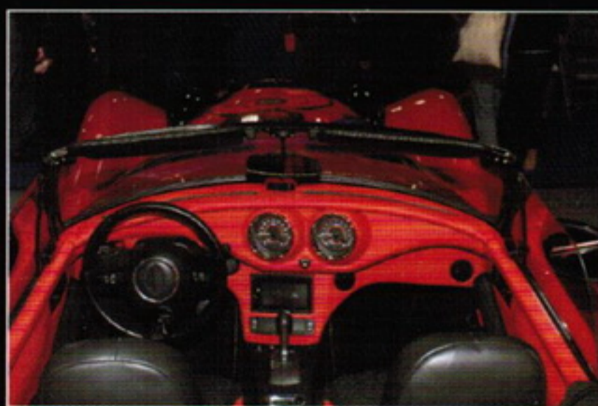
▲內裝同樣融合了古典與現代風格，以碳纖維及真皮包覆而成。