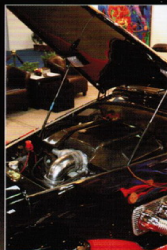
▶6.2升V8機械增壓引擎可輸出556p/83.5kgm充沛動力，僅需4秒即可加速破百！